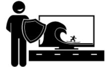
TV Extended Warranty